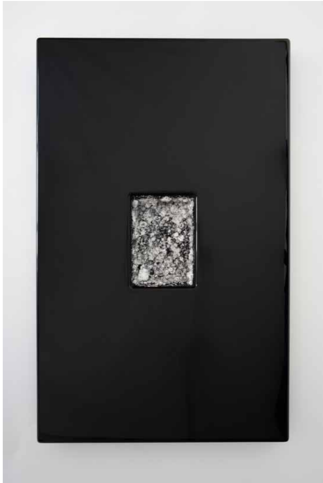
Radonna, 2018 80x50x6 cm, Wandskulptur mit darin gezüchteten Alaunkristallen zur Gesichtsbehandlung; radonisierte Alaunkristalle, Polymergips, Holz, Lack