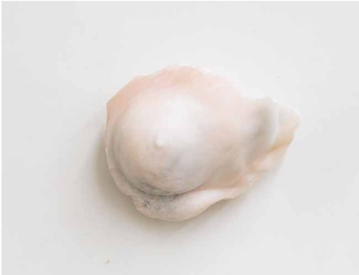
Augenblick (Brust), 2018 20 x 25 x 12 cm, Speckstein geschnitzt und geölt