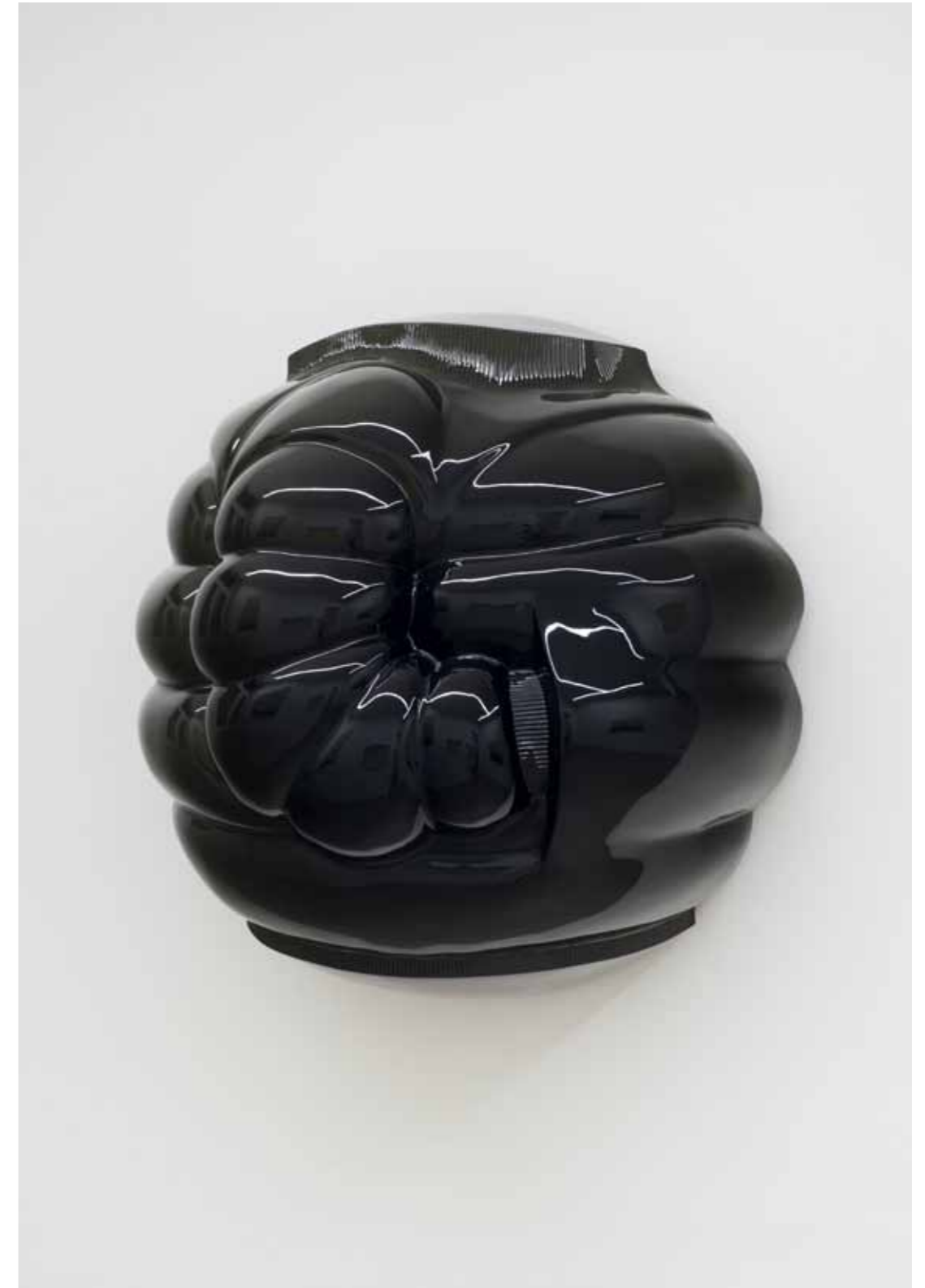
Rüstung, 2018 80 x 80 x 40 cm, Wandskulptur; Polymergips, Lack, Holz