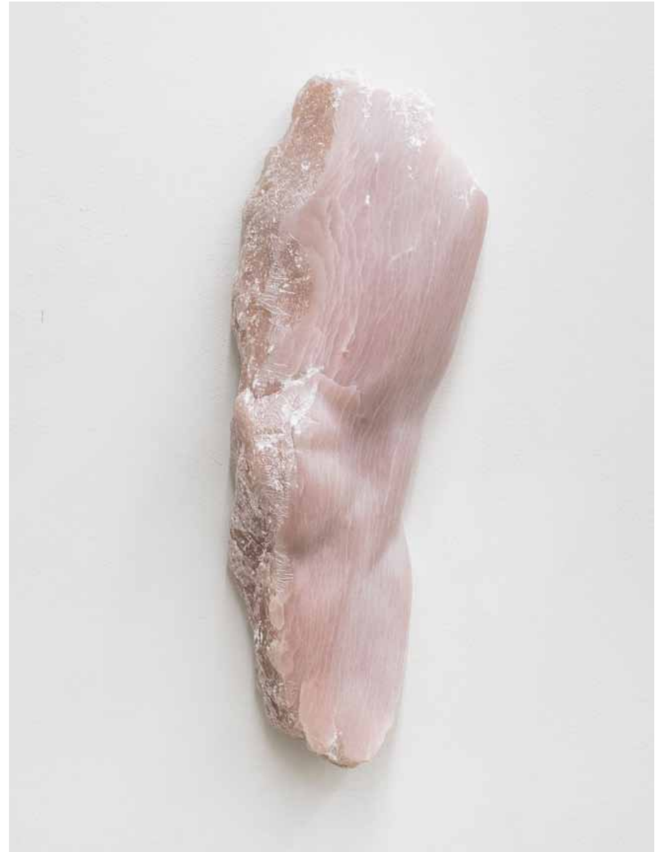
Augenblick (Bein), 2018 45 x 15 x 8 cm, Speckstein geschnitzt und geölt