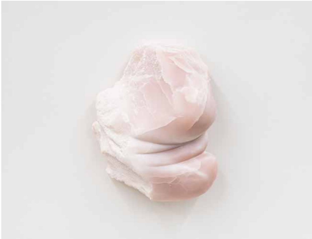
Augenblick (Bauch), 2018 27x25x7 cm, Speckstein geschnitzt und geölt