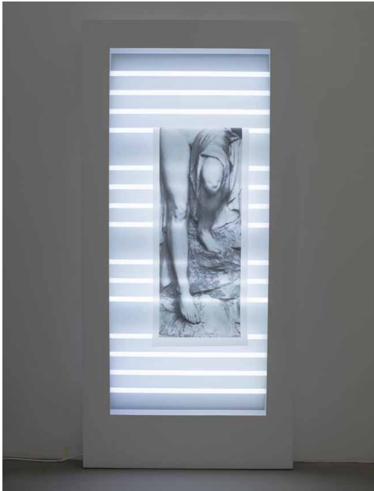
Leiter, 2018 240 x 114 x 8 cm, Siebdruck auf Tageslichtneons; Leuchtstoffröhren, Holz, Leuchtkastenfolie, Siebdruckfarbe, Lack