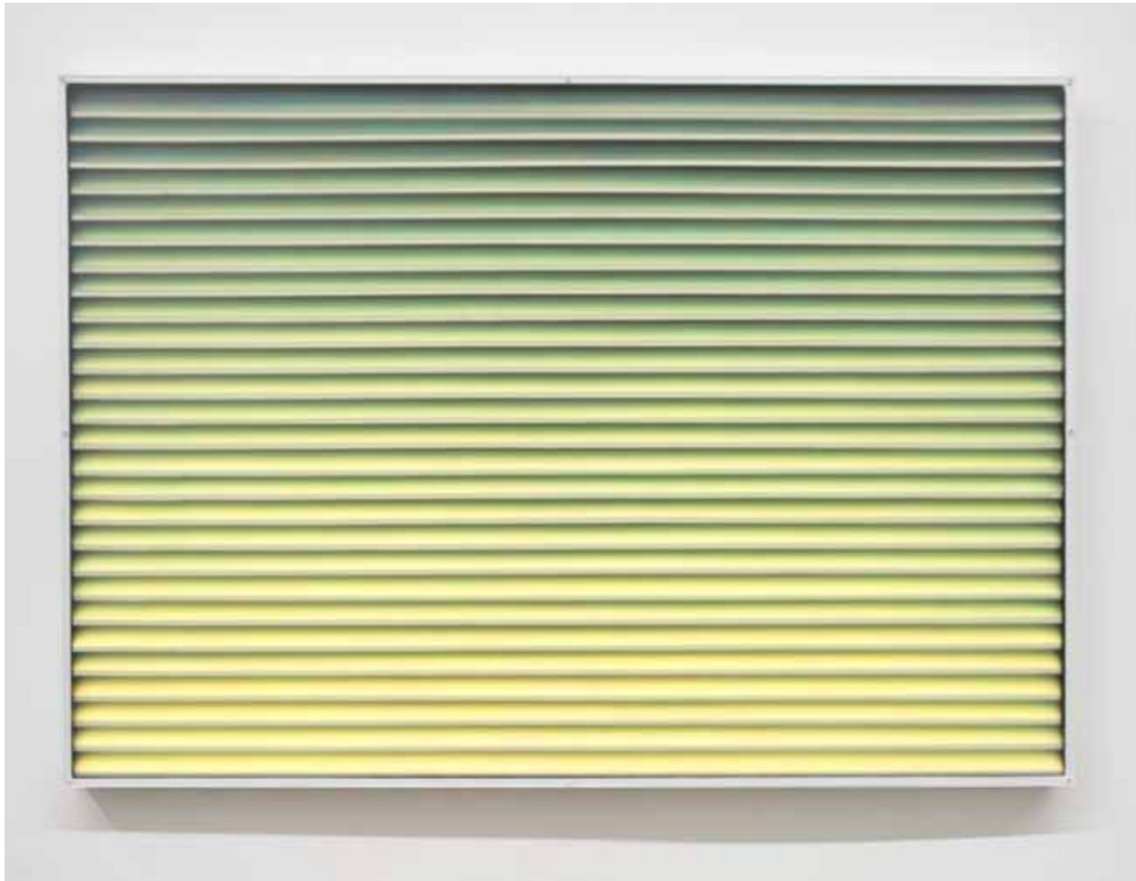
Daytona Beach, 2018 70 x 100 x 3,5 cm, Holz, Reflektorfolie, Lack, Leichtschumpappe, satiniertes Acrylglas