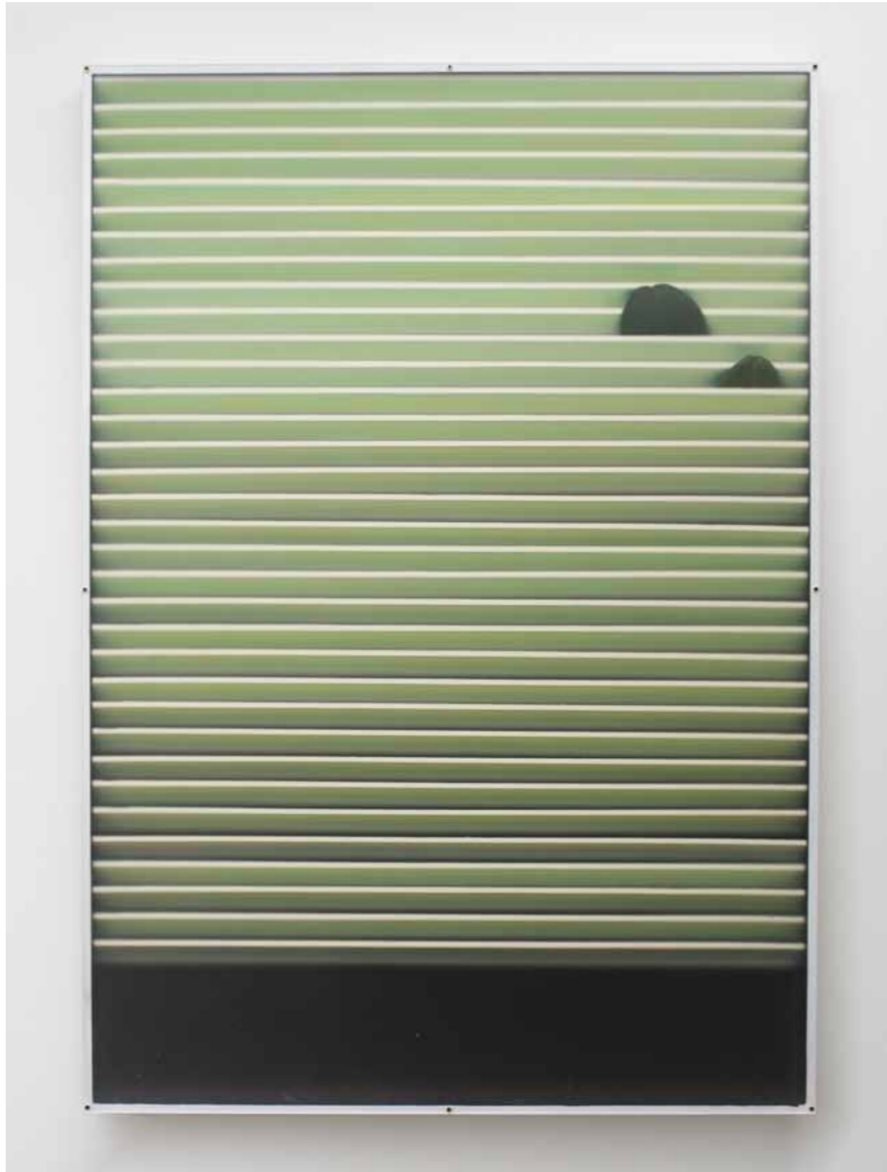
Daytona Beach, 2018 100x70x3,5 cm, Holz, Kunststoffpflanzen, Reflektorfolie, Lack, Leichtschaumpappe, satiniertes Acrylglas