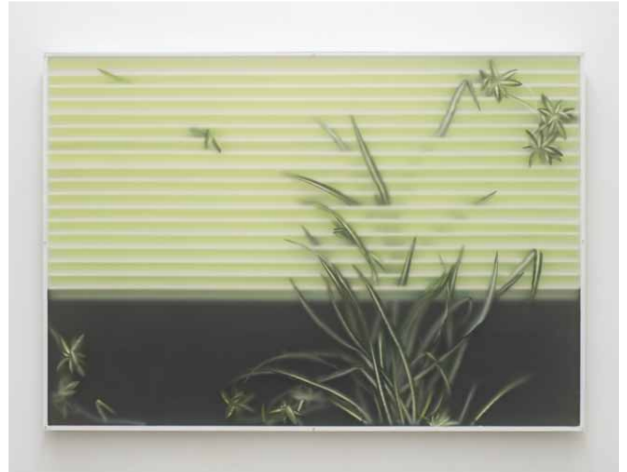
Daytona Beach, 2018 70 x 100 x 3,5 cm, Holz, Kunststoffpflanzen, Reflektorfolie, Lack, Leichtschumpappe, satiniertes Acrylglas