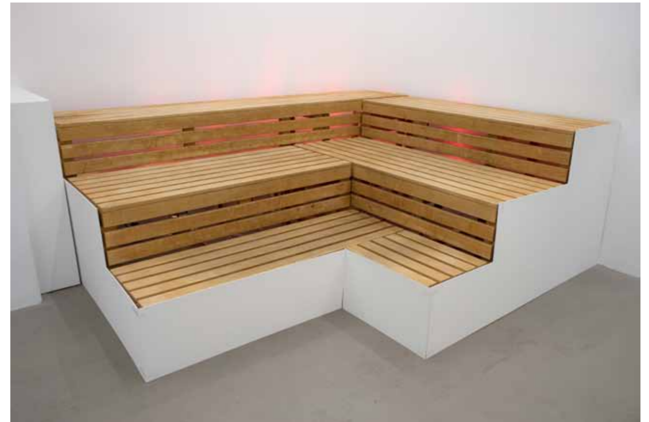
Rote Bänke, 2018 290 x 240 x 97 cm, Installation mit Saunabank, Duftdiffusor und Infrarotlampen