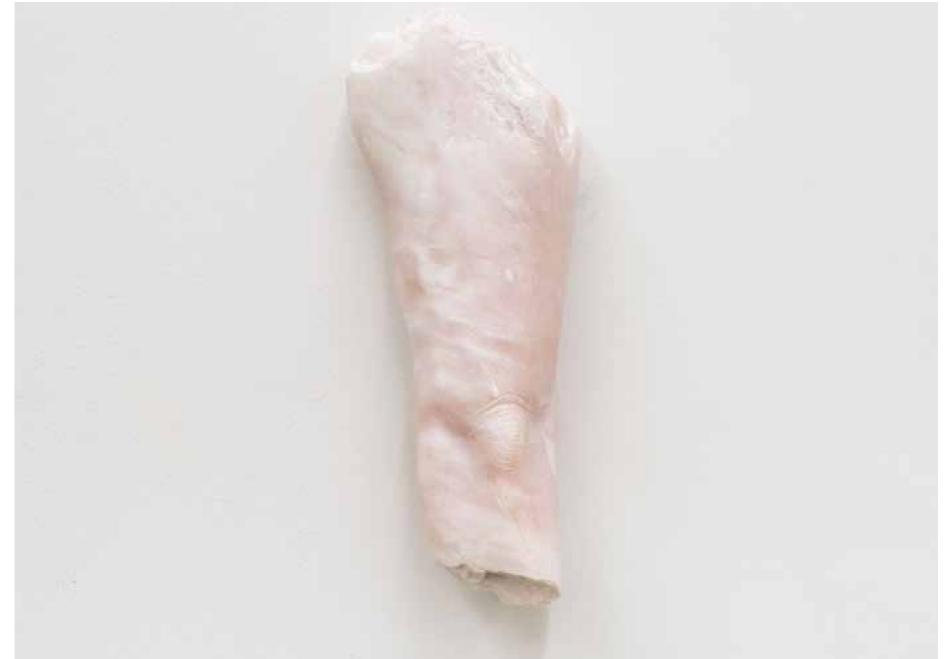
Augenblick (Arm), 2018 32x13x7 cm, Speckstein geschnitzt und geölt