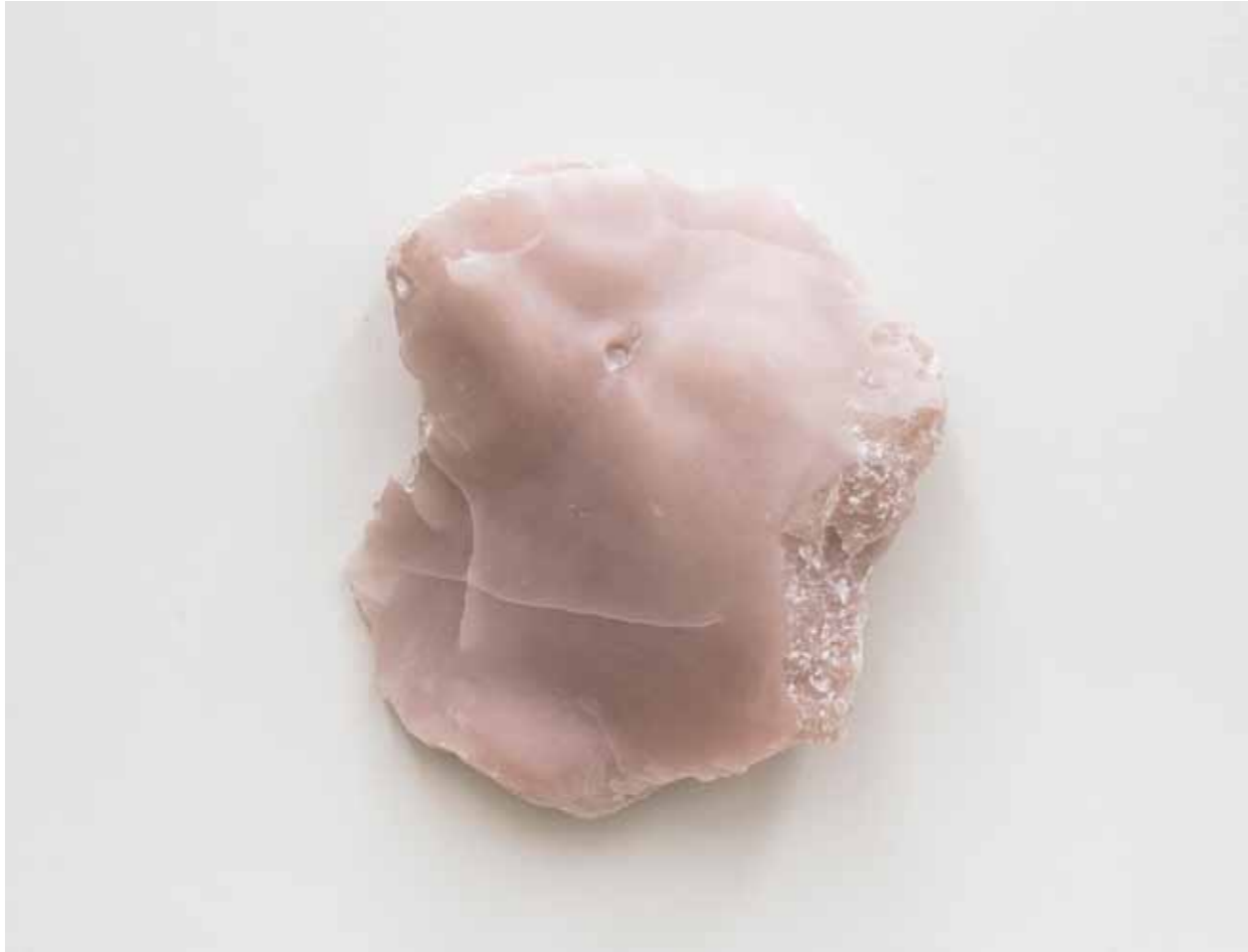
Augenblick (Torso), 2018 33 x 25 x 10 cm, Speckstein geschnitzt und geölt